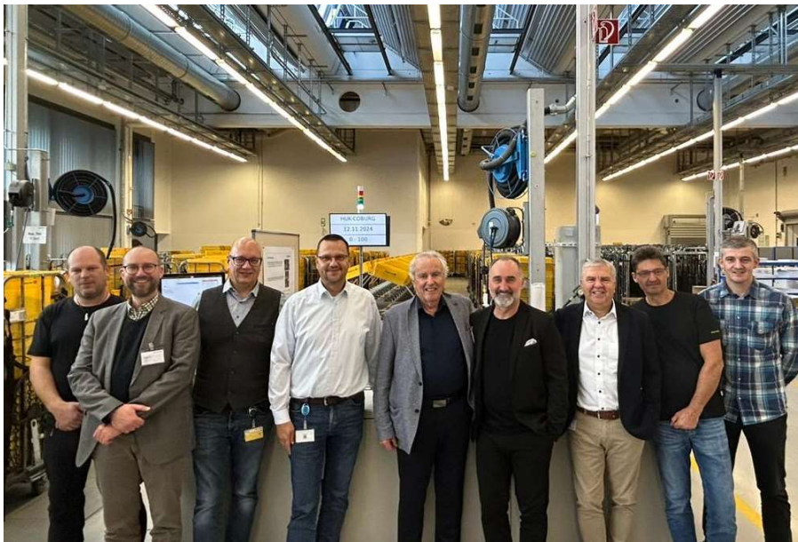
Das Team von HUK-COBURG + PROLISTIC

Die HUK-COBURG investiert in die Zukunft und installiert im Rahmen einer Ersatzinvestition das hochmoderne MAXIM-Hochleistungserfassungs- und Sortiersystem von PROLISTIC. PROLISTIC stellt mit diesem Auftrag von nun an den kompletten Briefsortierpark bei der HUK-COBURG.